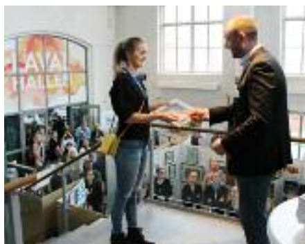
Stipendier delades ut 2019 i Lavalhallen.

Som SK-medlem har du chansen att erhålla ett stipendium på 5.000 kronor som kommer att delas ut sista dagen på utställningen.