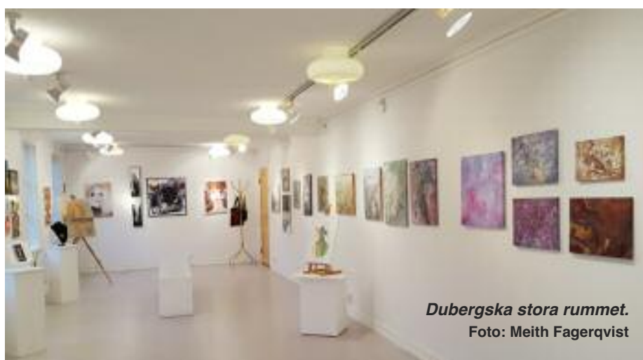
Dubergska stora rummet.